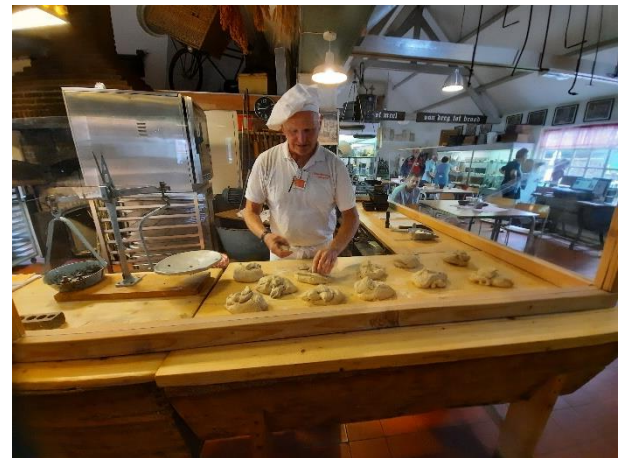
De bakker met de deegklompen

We werden hartelijk ontvangen met koffie, thee of warme chocolade melk.