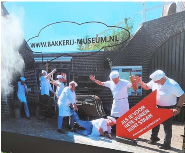
“Bakkerijmuseum De Grenswachter”