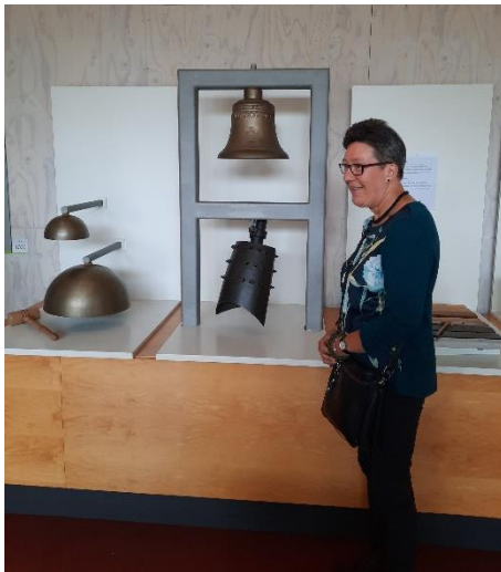
Het was fantastisch, echt een aanrader.

Na deze rondleiding in het museum zijn we toe aan een drankje en een stukje vlaai