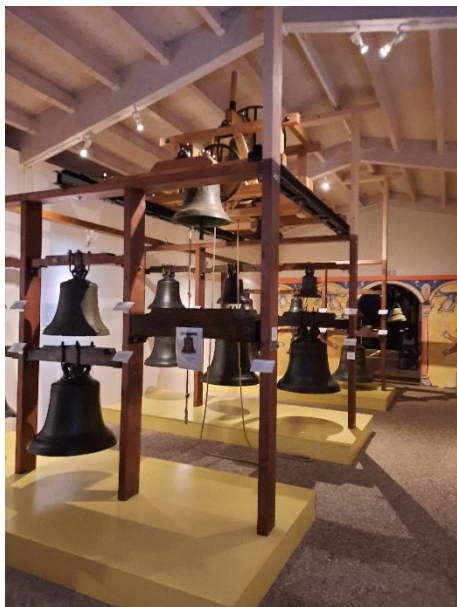
Carillons in verschillende uitvoeringen.