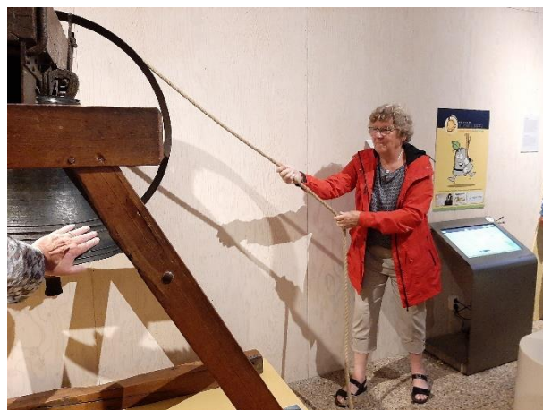
Gemma mag de klok luiden