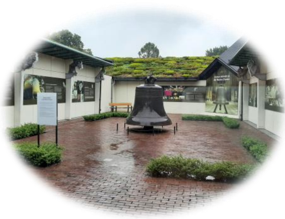
← Dit is een replica van een klok uit de Notre Dame

Even de trilling van het geluid voelen in het water→.